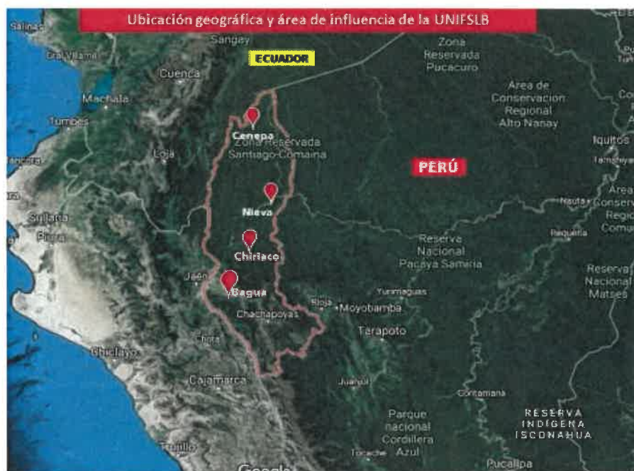
Fig.2 Ubicación geográfica y área de influencia de la UNIFSLB.